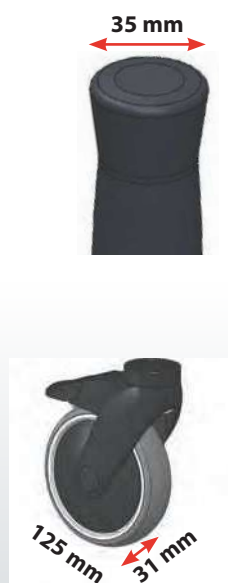
Visuels non contractuels